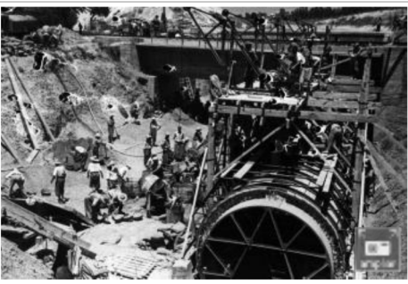
Presos republicanos, durante la construcción del Canal del Guadalquivir.

La burocracia lo justifica todo por escrito. También la ignominia y la miseria. "Vale por dos botes de leche para un evadido enfermo procedente del campo rojo, por prescripción del médico". El 23 de febrero de 1938, el cabo de guardia autorizó en una nota manuscrita el extra alimenticio (¡dos botes de leche!) a un enemigo enfermo. Luego estampó el sello de la Comandancia Militar de Fraga (Huesca). Mientras los españoles se mataban entre sí, la miseria y la ignominia avanzaban haciendo estragos.