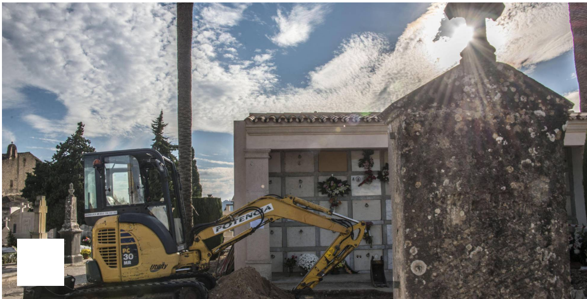
Trabajos de exhumación de más de 100 personas en el cementerio de Porreres.

Palma de Mallorca - 2 NOV 2016 - 20:14 CET