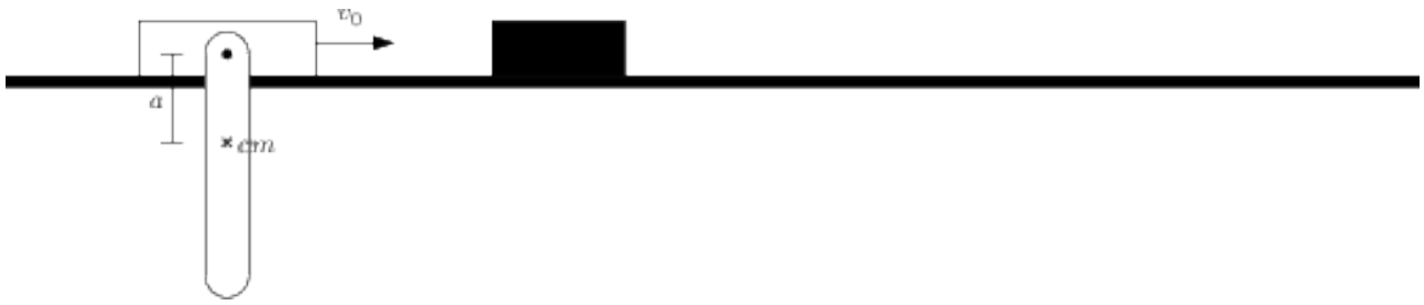
Figura 3.2: Il sistema prima dell'urto.

Esercizio 11. Supponiamo che il supporto si trovi inizialmente in moto con velocità costante v_0 , e che la sbarra sia in posizione verticale in equilibrio stabile. Ad un certo momento il supporto incontra un ostacolo che lo blocca improvvisamente. Calcolare per quale valore minimo di v_0 la sbarra compie un giro completo.